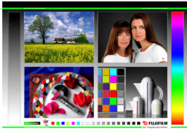
Abh. 4· Die Datei VISCHECK.TIF

Als ersten Schritt sollten Sie die Darstellung des Monitors möglichst genau an die Vorlagen des Testsets anpassen. Stellen Sie sicher, daß Sie stets mit den gleichen Helligkeits- und Kontrasteinstellungen Ihres